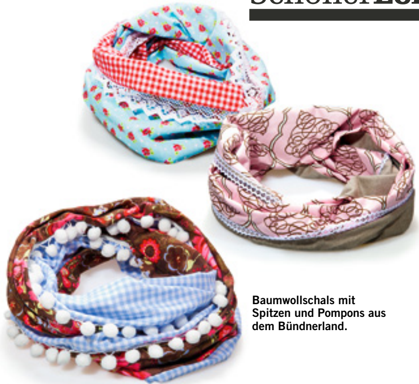
Baumwollschals mit Spitzen und Pompons aus dem Bündnerland.